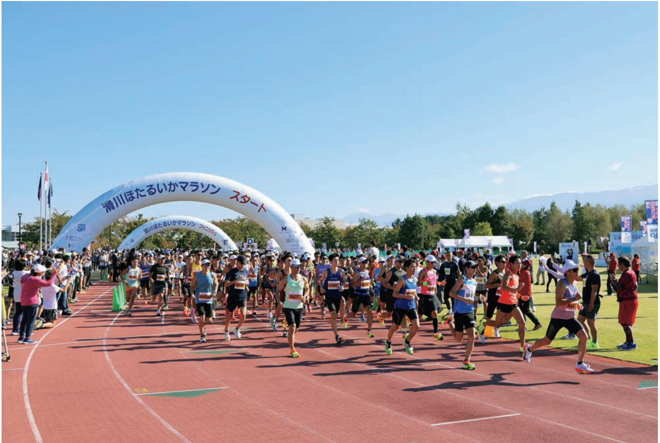
滑川ほたるいかマラソン (滑川市)