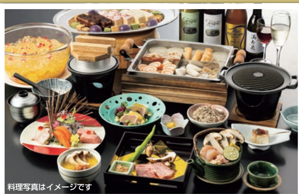
料理写真はイメージです