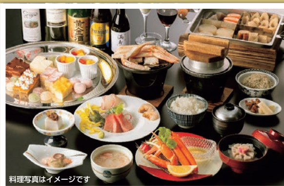
料理写真はイメージです